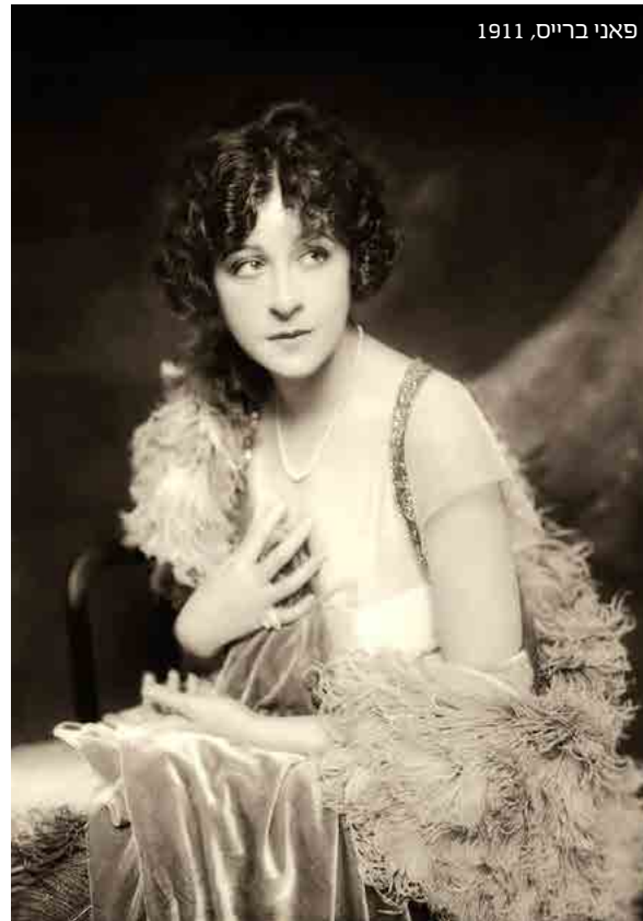
פאני ברייס, 1911