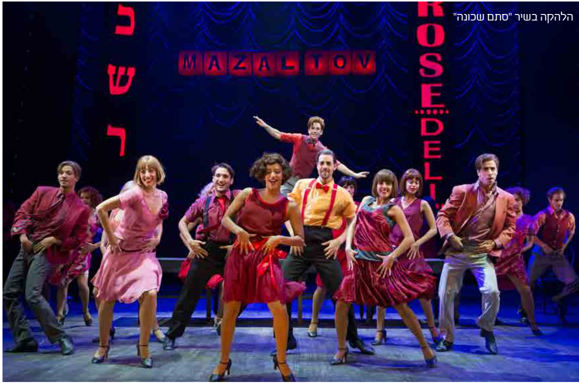
הלהקה בשיר "סתם שכונה"